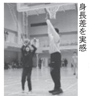
ゴール下でプロ選手との身長差を実感

また、合宿期間中は、練習を自由に参観できたり、小学校ミニバスチームにバスケットの指導や村民との交流会が行われるなど、プロ選手と触れあえる良い機会となりました。