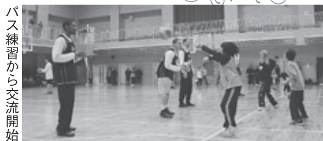
バス練習から交流開始

1月2日（水）～4日（金）、中学校大体育館及び村民体育館において、秋田のプロバスケットボールチーム「秋田ノーザンハピネッツ」が正月合宿を行いました。合宿は、決められた秒数の中で選手の連携を確認するなど、試合を行っているかのような練習が行われていました。