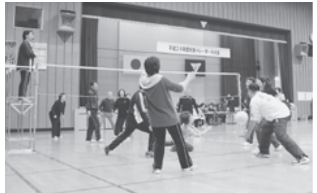
各部門とも熱戦が繰り広げられました