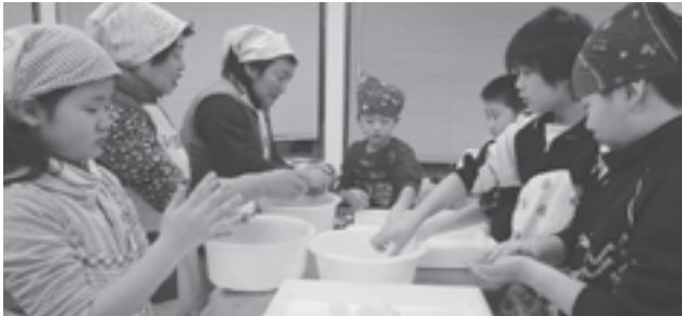
夕食のだまこづくり。この夕食で「だまこ10個、スープ3杯」を食べた大潟っ子も。

屋内では、サンドイッチ、パン作り、そば打ちやだまこづくりをし、協力して作ることを体験しました。それ以外にも、ユニカール・ミニテニス・卓球など室内での活動も声を掛け合い意欲的に取り組みました。