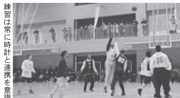
練習は常に時計と連携を意識