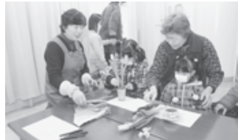
昨年の生け花体験の様子