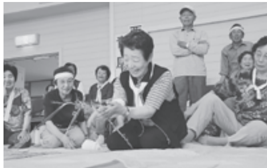
縄ないも手慣れたもの

運動会は、最初の種目「関所破り」から盛り上がりました。これは、じゃんけんが勝てば関所を通過できるルールで、何回じゃんけんしても勝てない方へ特に声援が送られていました。「ビンつり競争」は、棒が付いた紐をビンの口に入れてつり上げる競技。棒は入るのですが、ビンになかなか引っかからない方もおり、笑い声があふれていました。「縄ない競争」は、その名のと通りの競技。各チームから5人ずつ縄ないの名手が出場し、見事な手さばきで稲わらから縄をなっていく姿に歓声が送られていました。保育園児と幼稚園児の種目は、「おやつをめざせゴー！」と「なかまをさがして」。おやつをもらったり、ペアとなるおじいちゃんおばあちゃんの肩をたたいたり、園児たちも楽しんで運動会に参加していました。