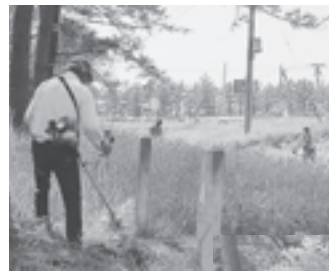
壮悠会による干拓記念碑周辺の草刈り

いずれの場所も、毎年ボランティアで草刈りを行っていただいております。皆さん、暑い中で汗をかきながらの作業、本当にありがとうございました。