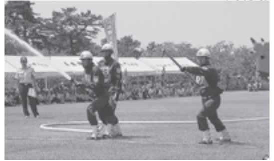
惜しくも優勝を逃した第2分団の小型ポンプ操法

ポンプ車操法の部で優勝した第3分団は、8月28日（火）に由利本荘市の県消防学校で開催される第49回秋田県消防操法大会に出場します。皆さまの応援をよろしくお願いします。