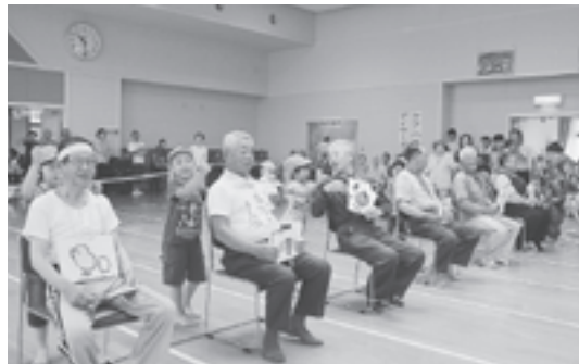
可愛い手でおじいちゃんおばあちゃんの肩をトントン