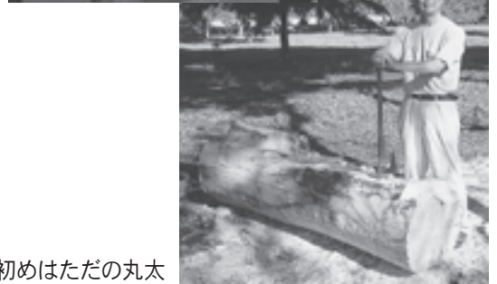
初めはただの丸太