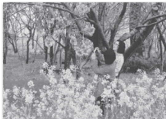
優秀賞「花と戯れるⅡ」 畠山 幸義 (秋田市)