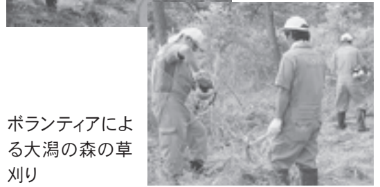
ボランティアによる大潟の森の草刈り