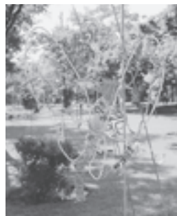
カラーワイヤーによる作品