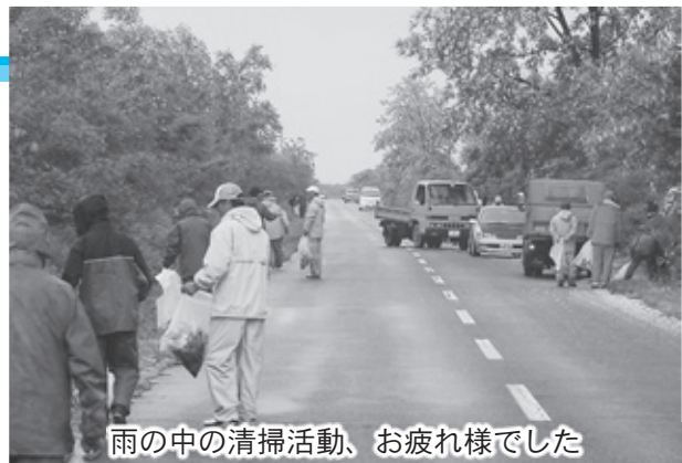
雨の中の清掃活動、お疲れ様でした