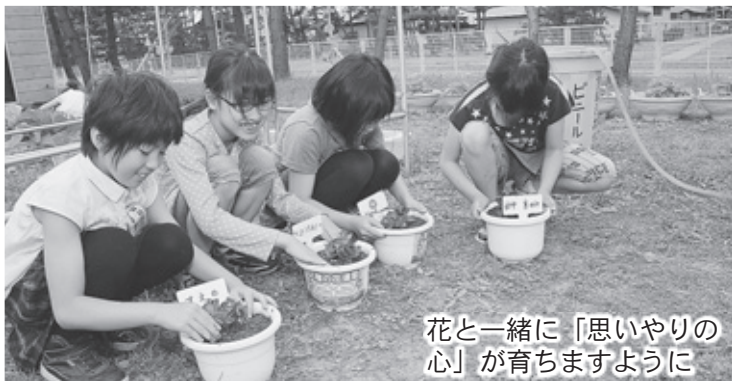
花と一緒に「思いやりの心」が育ちますように