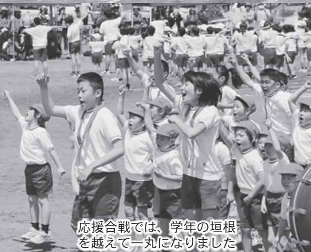
応援合戦では、学年の垣根を越えて一丸になりました