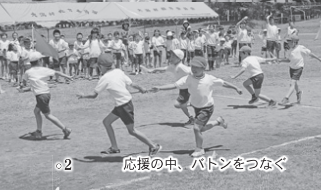
○2 応援の中、バトンをつなぐ