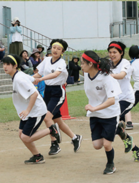
最後の大勝負！色別対抗選手リレー