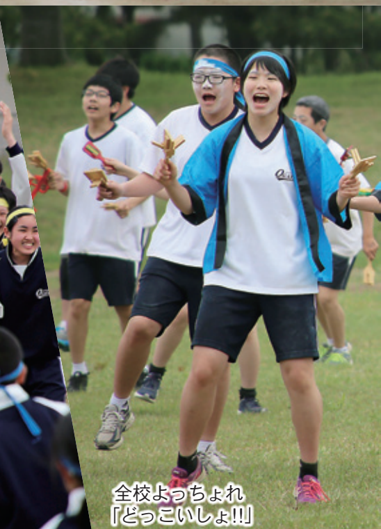
全校よっちょれ「どっこいしょ!!!」