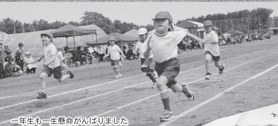
一年生も一生懸命がんばりました

勝負の行方に関わらず、一人ひとりが全力を出し切り、全員で協力したすばらしい運動会でした。