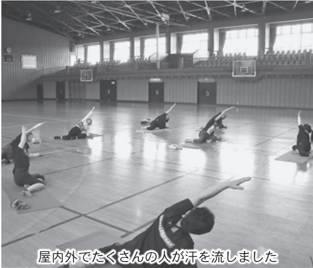
屋内外でたくさんの人が汗を流しました

チャレンジデー当日は、農作業等の大変お忙しい中にも関わらず、多数ご参加ご協力をいただきました皆さまに対し厚くお礼申し上げます。