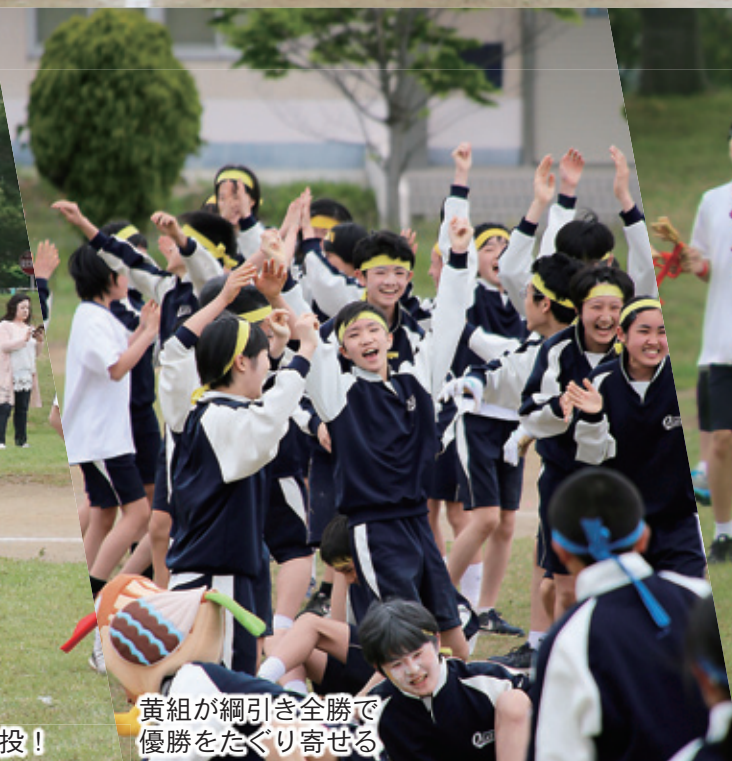
黄組が綱引き全勝で優勝をたぐり寄せる