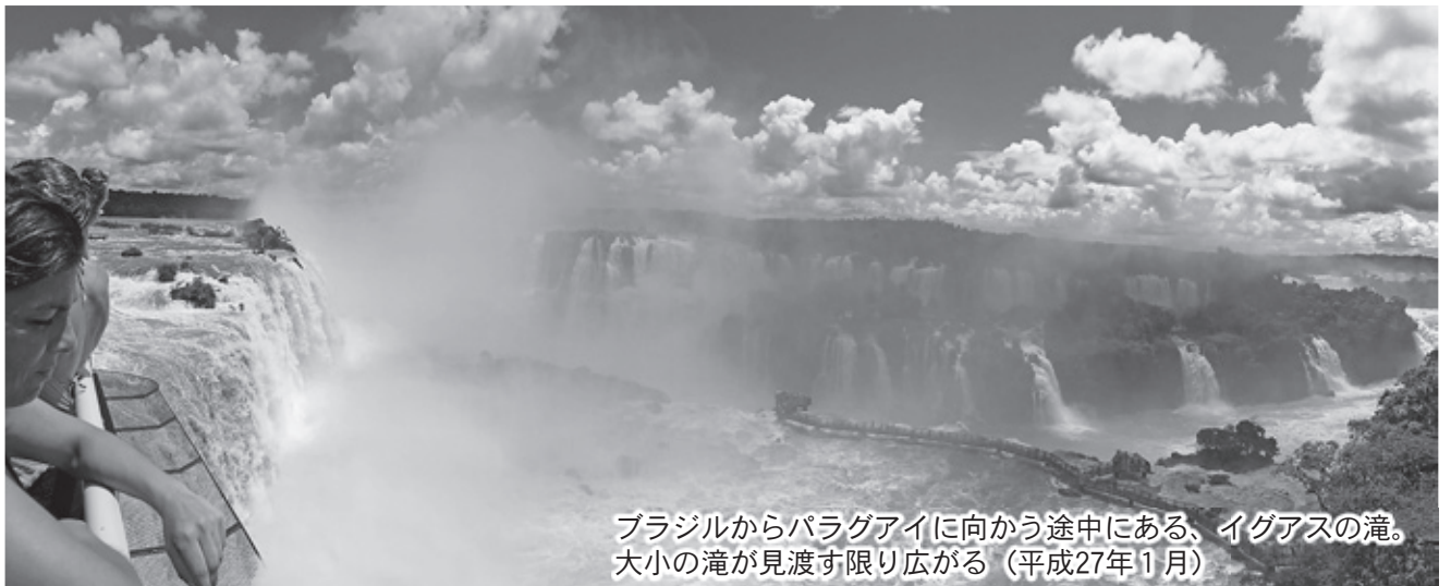
ブラジルからパラグアイに向かう途中にある、イグアスの滝。大小の滝が見渡す限り広がる（平成27年1月）