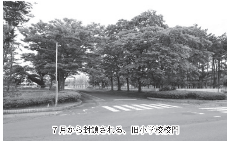
7月から封鎖される、旧小学校校門