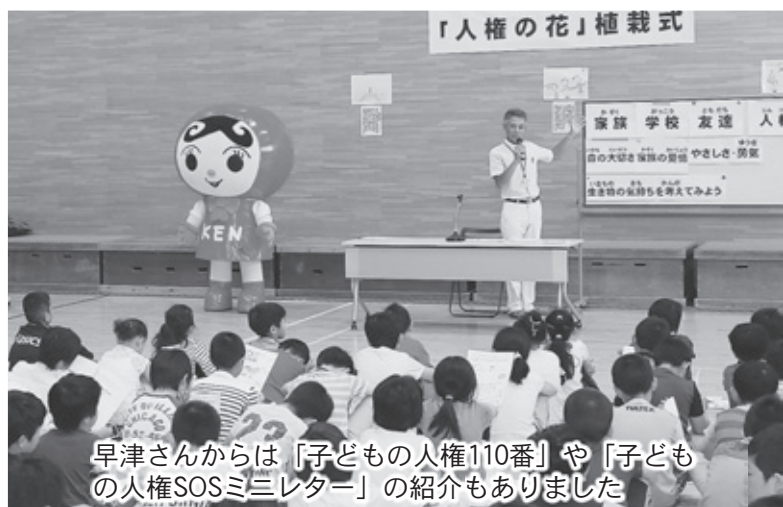
早津さんからは「子どもの人権110番」や「子どもの人権SOSミニレター」の紹介もありました

その後、屋外で花の植栽が行われ、児童たちは花の苗を大切に丁寧に鉢に植えていました。