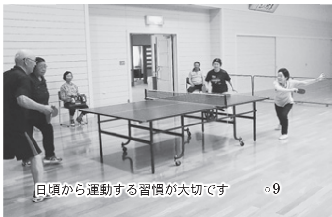
日頃から運動する習慣が大切です