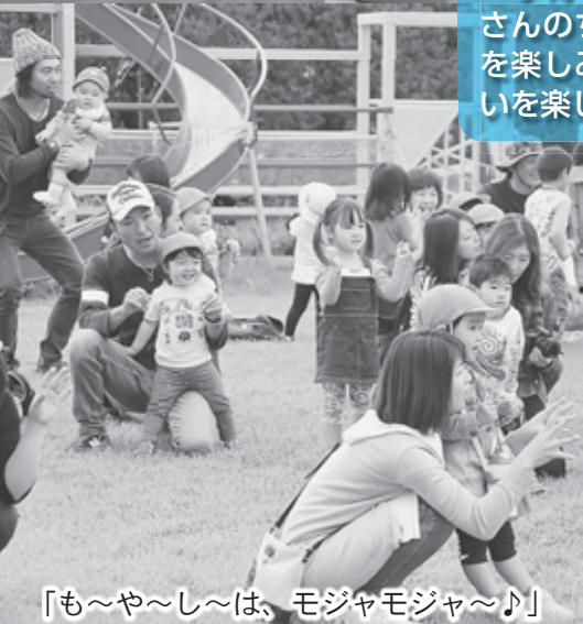
「も〜や〜し〜は、モジャモジャ〜♪」