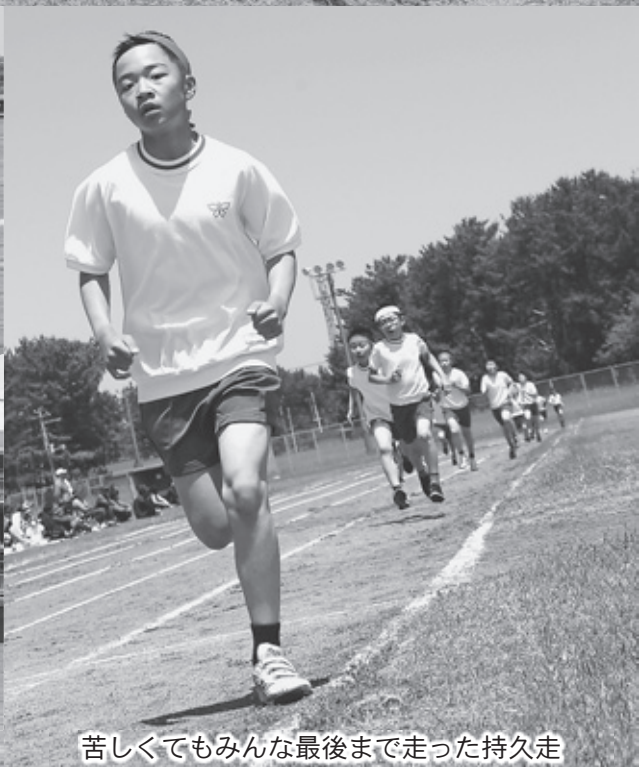
苦しくてもみんな最後まで走った持久走