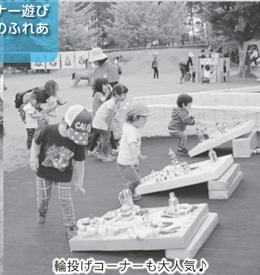
輪投げコーナーも大人気♪