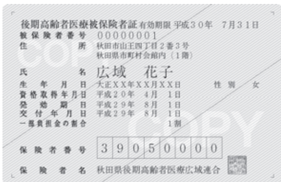
新しい保険証はみず色です