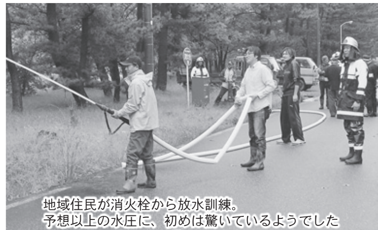
地域住民が消火栓から放水訓練。予想以上の水圧に、初めは驚いているようでした