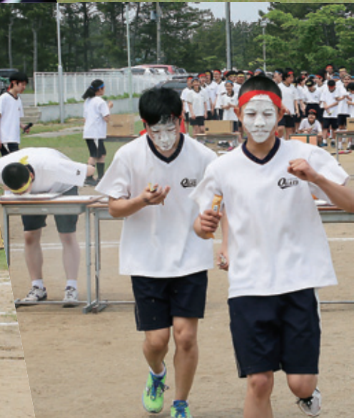
恒例の生徒会遊競技でみんな真っ白