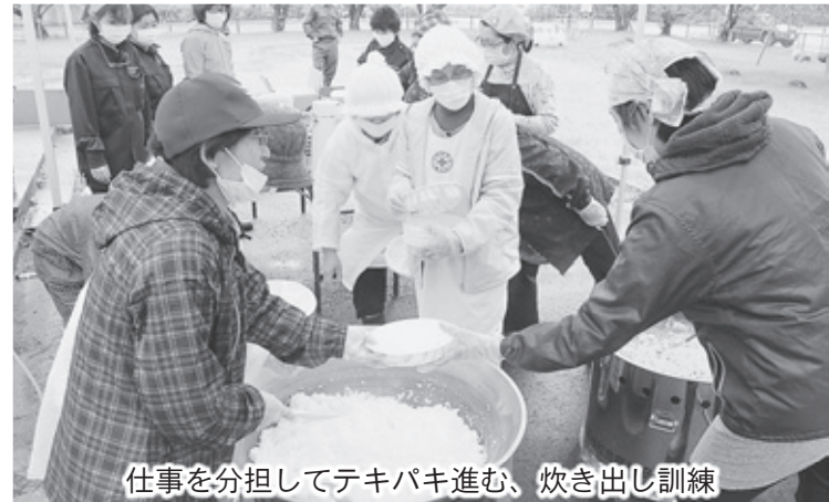
仕事を分担してテキパキ進む、炊き出し訓練