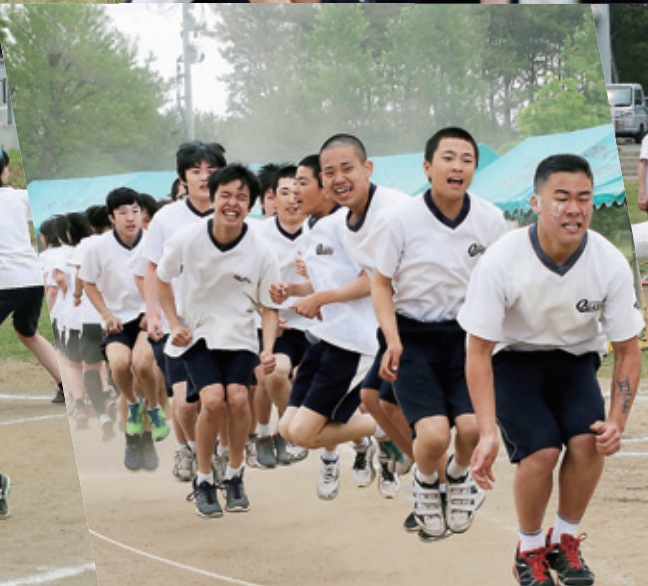
学級対抗ロープジャンプ。本番に強い3年生が自己ベストで優勝！