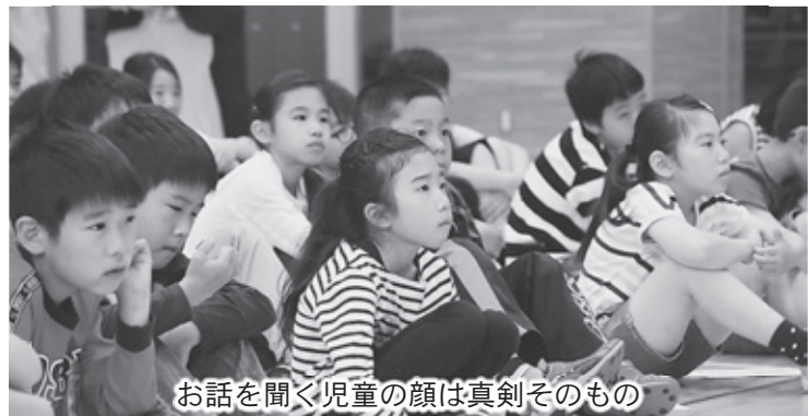
お話を聞く児童の顔は真剣そのもの