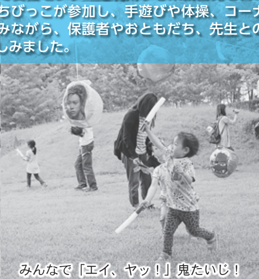
みんなで「エイ、ヤッ!」鬼たいじ!