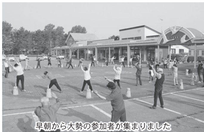
早朝から大勢の参加者が集まりました