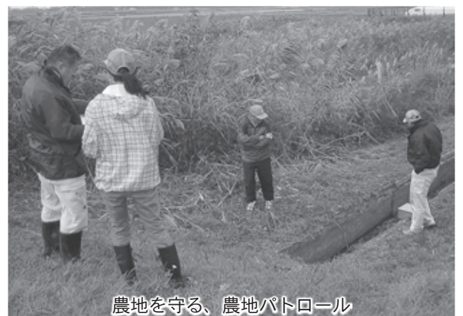
農地を守る、農地パトロール