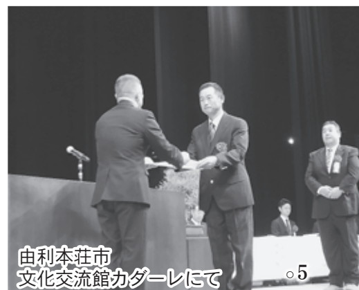
由利本荘市文化交流館カダールにて