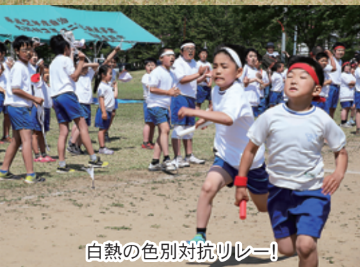
白熱の色別対抗リレー!

6月1日(土)、大湊小学校大運動会が開催されました。 会場には、保護者や地域の方々が応援に駆けつけ、どの競技もとても白熱し目が離せない展開に。 児童も保護者も大盛り上がりで、令和の始まりにふさわしい、素晴らしい運動会になりました。