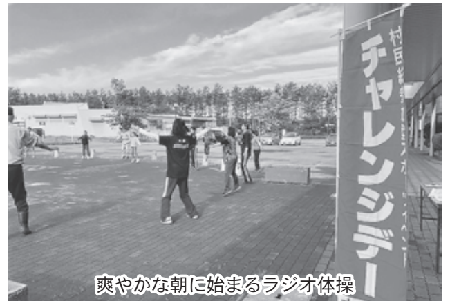
爽やかな朝に始まるラジオ体操

チャレンジデー当日は、農作業等の大変お忙しい中にも関わらず、多数ご参加ご協力をいただきました村民の皆さま、事業所の皆さまに対し厚くお礼申し上げます。