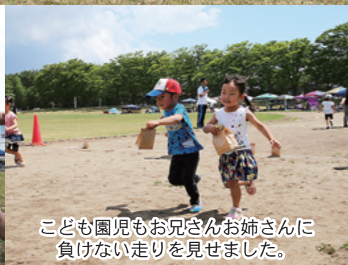
こども園児もお兄さんお姉さんに負けない走りを見せました。