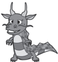
八郎湖水質保全 シンボルキャラクター 「清龍くん」