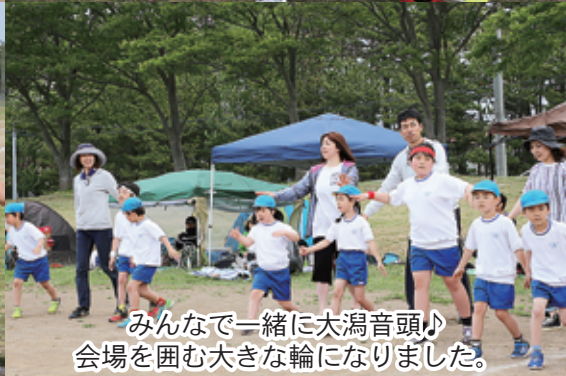
みんなで一緒に大湊音頭♪ 会場を囲む大きな輪になりました。