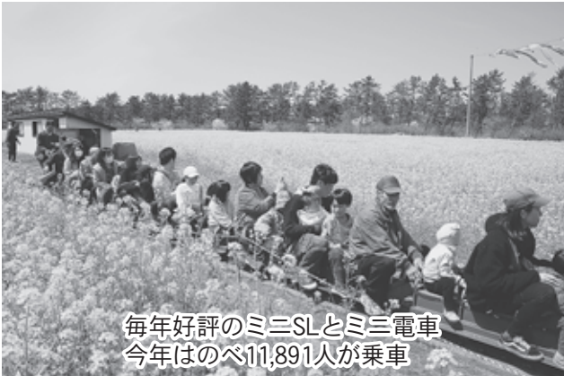
毎年好評のミニSLとミニ電車 今年のはべ11,891人が乗車

今後も、耕心会をはじめ、村民の皆さまや関係機関の協力を得ながら、観光振興、地域活性化の推進に努めてまいります。