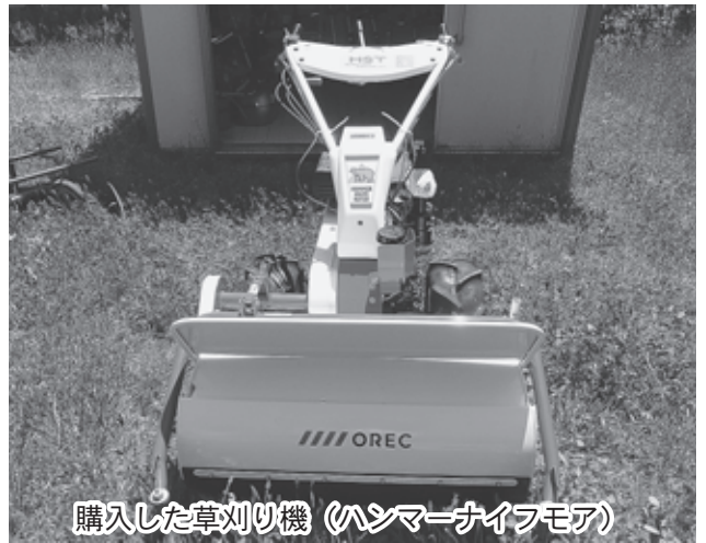
購入した草刈り機（ハンマーナイフモア）