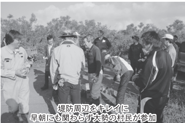
堤防周辺をキレイに 早朝にも関わらず大勢の村民が参加