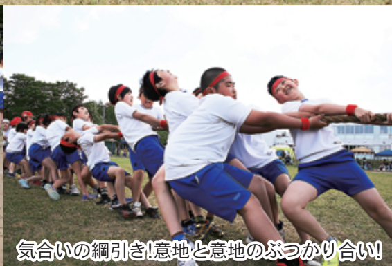
気合いの綱引き!意地と意地のぶつかり合い!