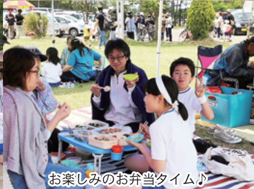
お楽しみのお弁当タイム♪