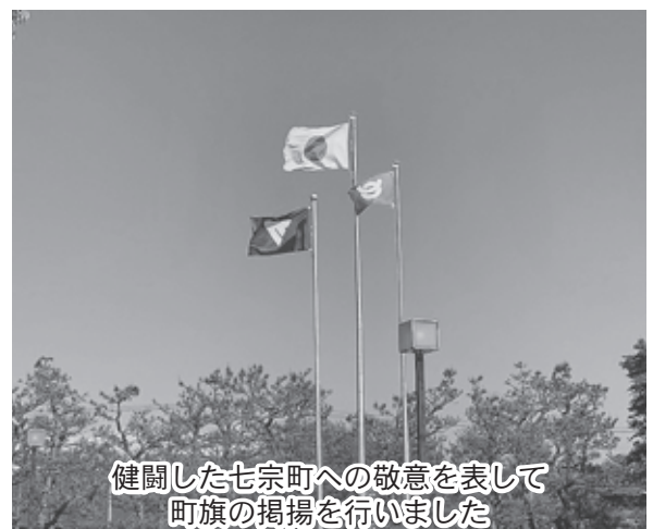
健闘した七宗町への敬意を表して町旗の掲揚を行いました