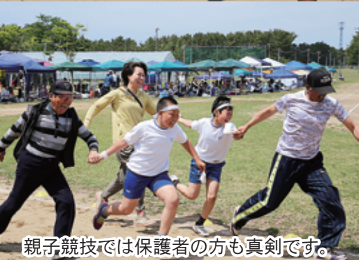
親子競技では保護者の方も真剣です。