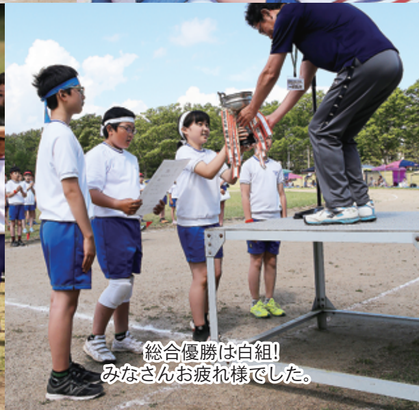
総合優勝は白組! みなさんお疲れ様でした。