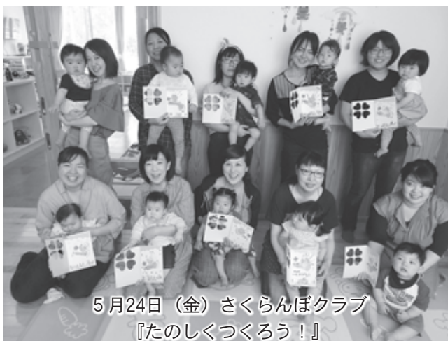
5月24日（金）さくらんぼクラブ 『たのしくつくろう!』