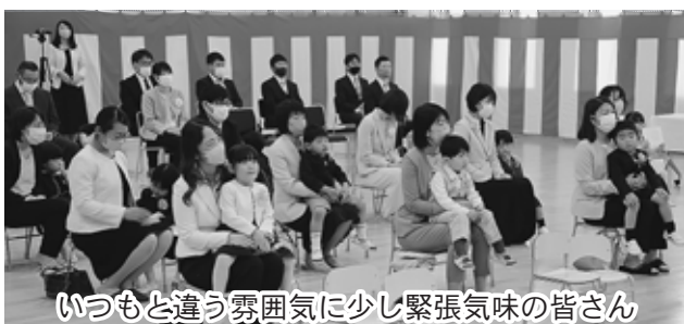
いつもと違う雰囲気少し緊張気味の皆さん