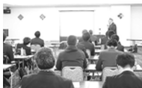
技術者を対象にした研修会