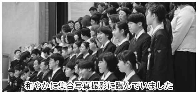
和やかに集合写真撮影に臨んでいました