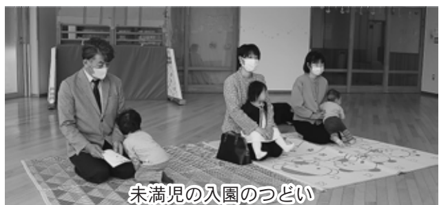
未満児の入園のつどい