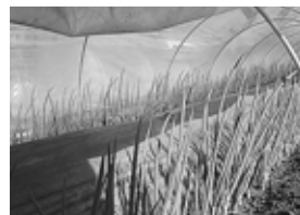
端境期向けのトンネル栽培ネギ