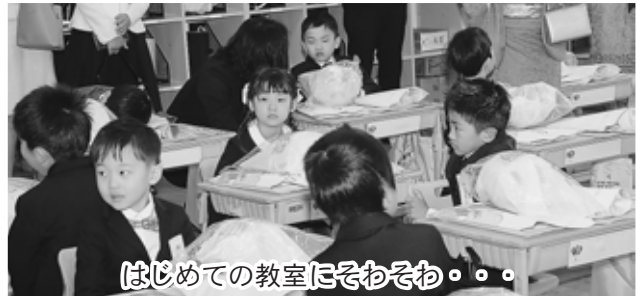
はじめての教室にぞわぞわ。。。