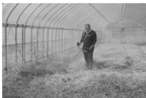
実証展示のための圃場整備