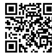
船越駅→大湯中学校