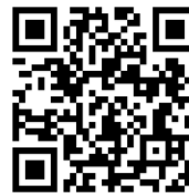
八郎潟駅→大湯中学校

https://maps.app.goo.gl/LV6np5nJbjNGZ7qE8