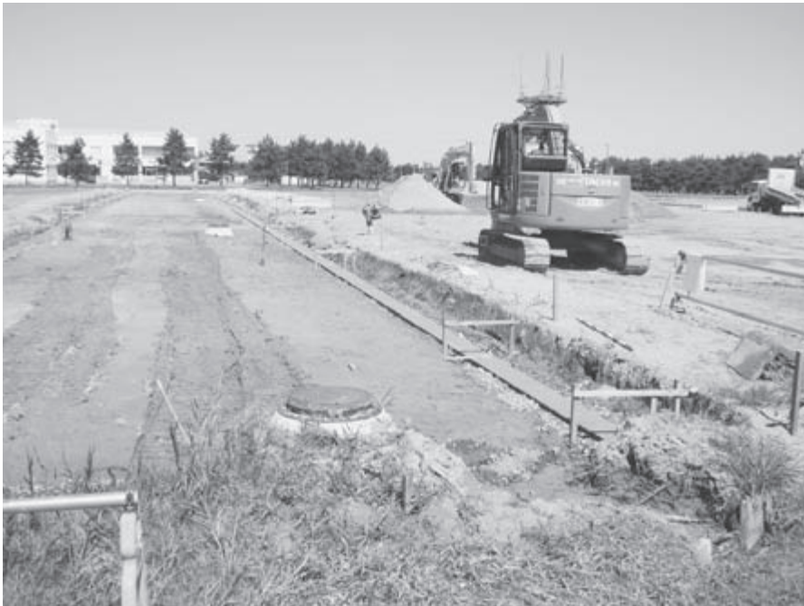
中央3番地内宅地造成工事

答 出資である。まずファンドが出資を行い、起業後一定期間が経過して事業が軌道に乗った時、起業者がファンド出資分を買い戻すことで、出資金は戻ることになる。配当金がある場合は、ファンド運営会社の利益を差し引いた残りが出資割合に応じて分配されることになる。ファンドへの自治体、信金の出資総額は1億円で、審査を経て数社へ出資される。