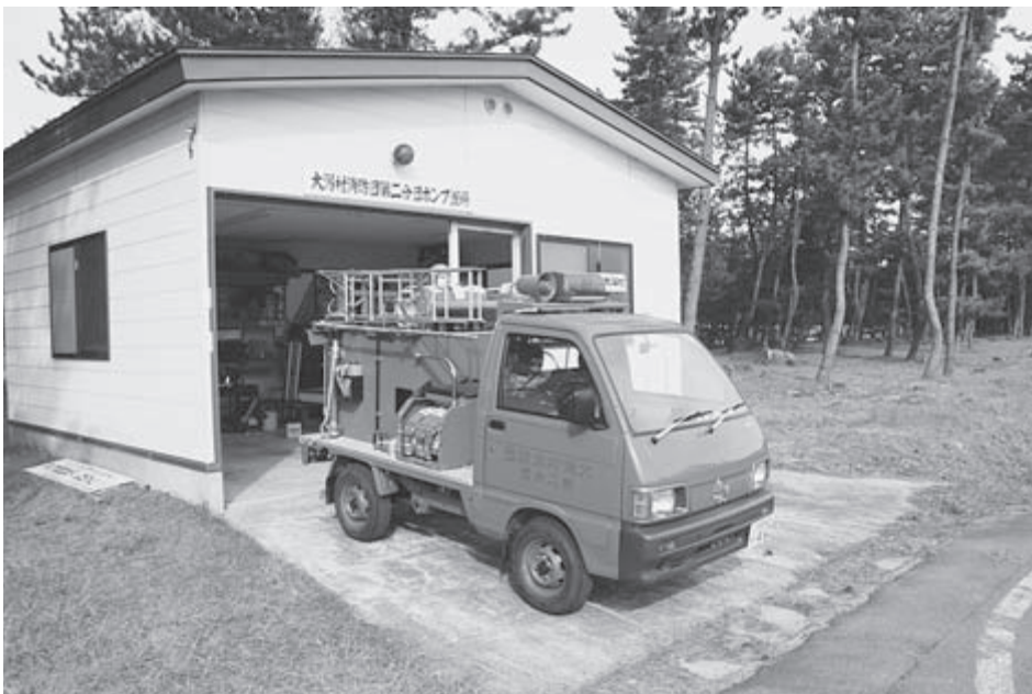
更新する小型ポンプ積載車

なっており、最初の2年は利息のみの支払いとなる。よつて、28、29年の負担金額が極端に少なくなっている。