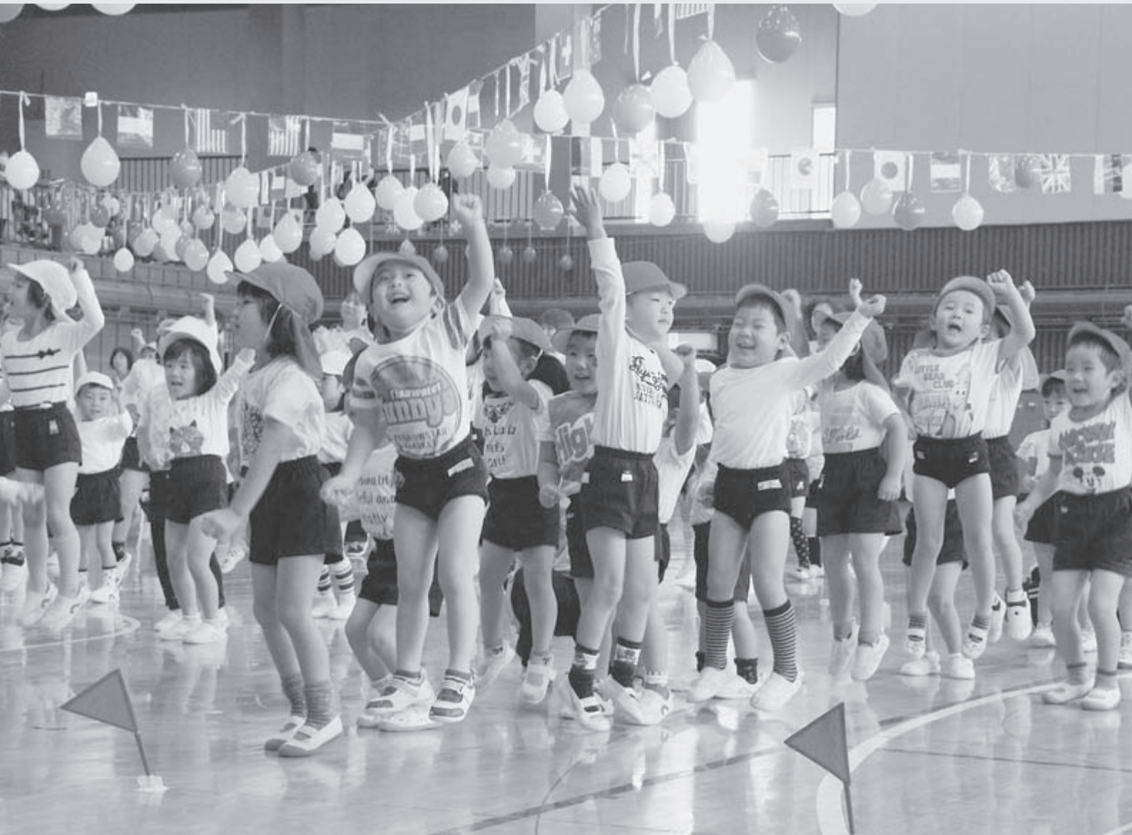
幼保ふれあい運動会「らんらんフェスタ」