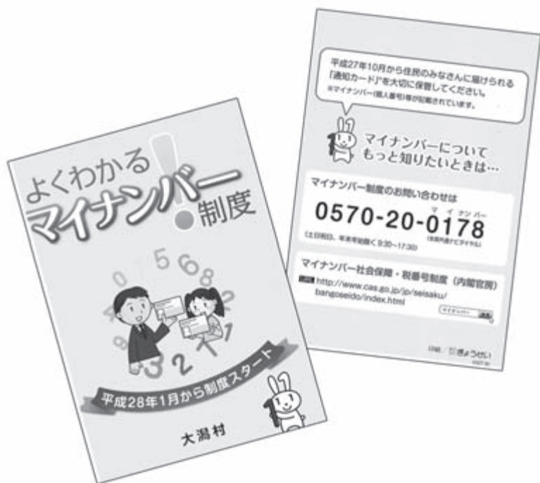
平成28年1月から始まるマイナンバー制度