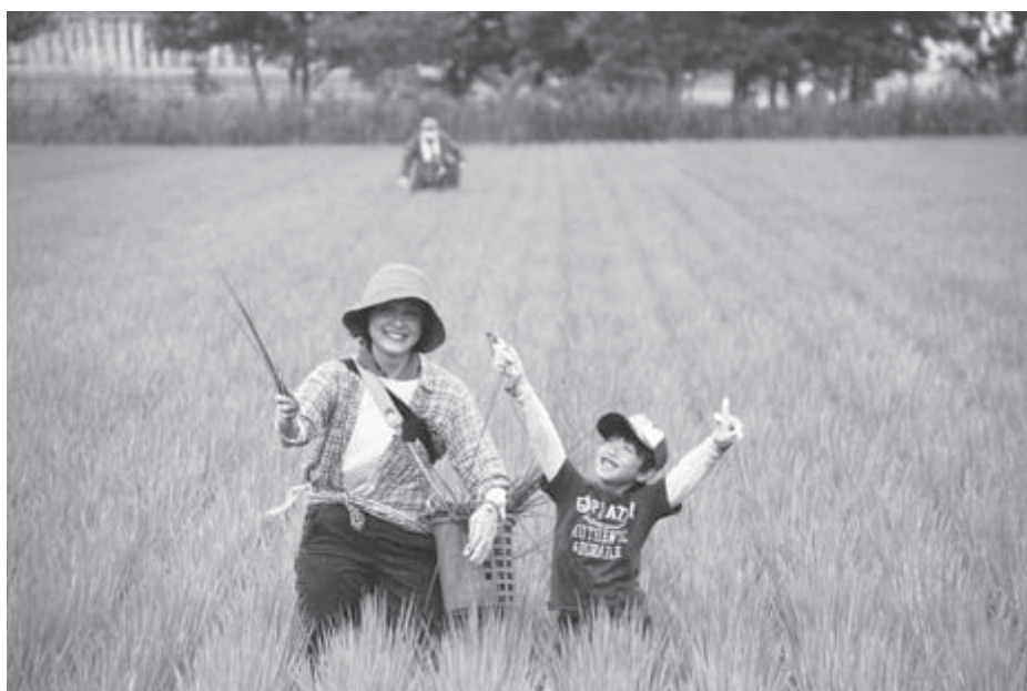
浦安市民農業体験ツアー

③ 総務企画課は総合戦略、産業建設課は農業特区と仕分けをしながら、庁内で連携してやっていく。まずは村の課題解決を重視し、それが将来に