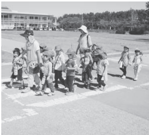
保育士が見守る園児の散歩

ホームルーム活動で、自覚を高めて行動できるよう子供たちに指導している。教員も生活安全、災害対応や交通安全等の研修を行いながら、あらゆる場面で子供たちの安全を第一に考えるよう見識を深めている。 今後の課題であるが、これまでと同様に子供の安全確保の継続的な推進が重要であり、現在1名のスクールガードリーダーをサポートするボランティアによる地域のスクールガードを組織化できるように検討していきたい。