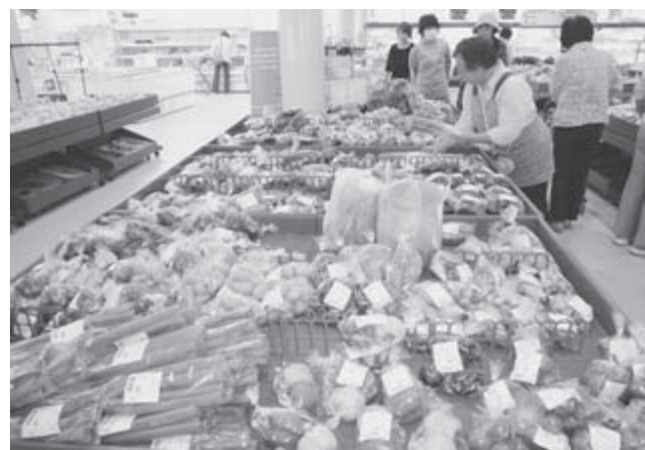
店頭に並ぶ村産野菜

答 村長 ①各施設において、コメは100%が村産である。野菜類は学校給食では、25年度で38%、26年度は46%に増えている。産直センターの食堂では25年度は40%あつ