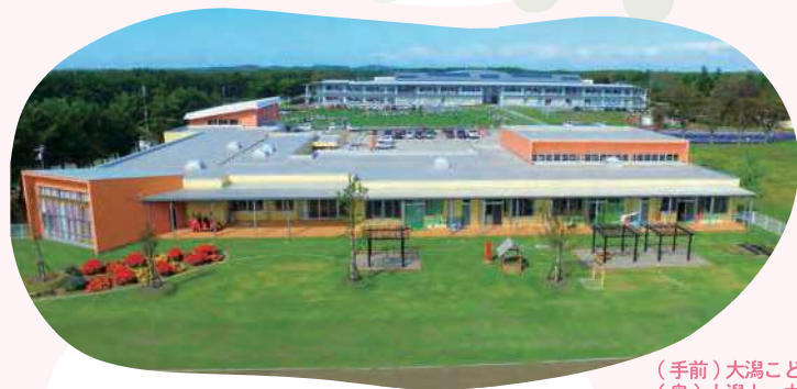
(手前)大潟こども園 (奥)大潟小・中学校

大潟幼稚園と大潟保育園が統合し、2018年に幼保連携型認定こども園「大潟村立大潟こども園」が発足しました。