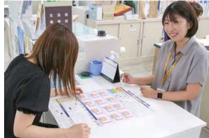
住民にごみの収集日や分別方法を説明するようす