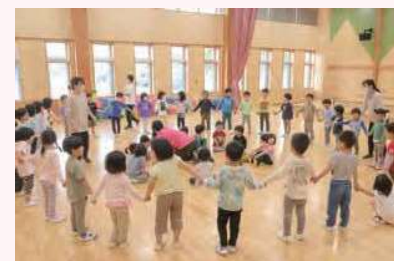
毎月月末は園児みんなが楽しみにしているお誕生日会。