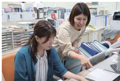
わからないところは先輩がサポート