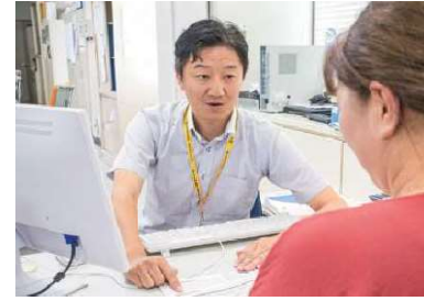
村民からの税金相談