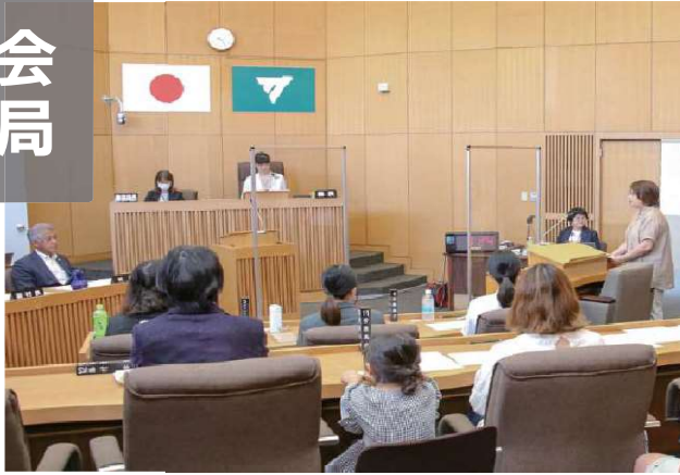
女性模擬議会のようす