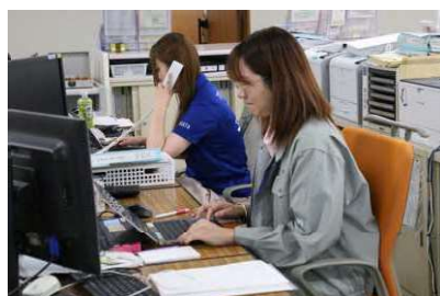
多くのシステムを使用しての業務