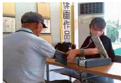
商店街「ちよこつと」での血圧測定