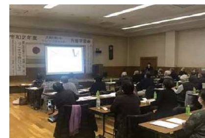
高齢者講座「フレイル予防について」のようす