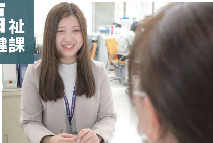
戸籍書類手続きの窓口業務のようす