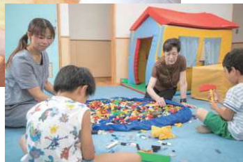
→新しい児童クラス園内は機能的