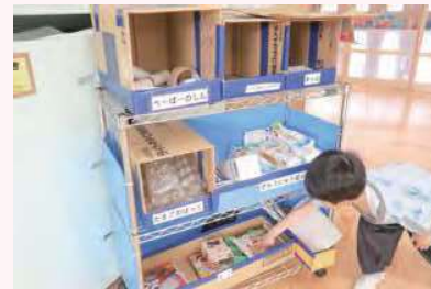
先生お手製の棚にお片づけ！ しっかり分別して収納できました。