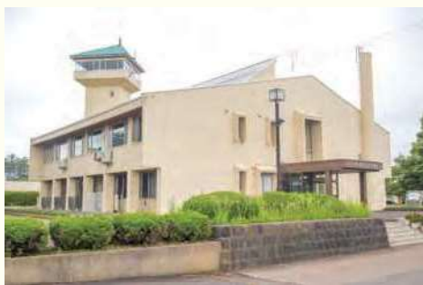
大潟村公民館 (教育委員会事務局)