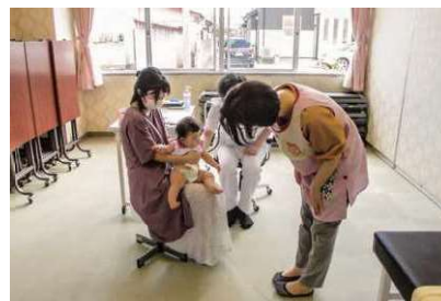
乳幼児健診のようす