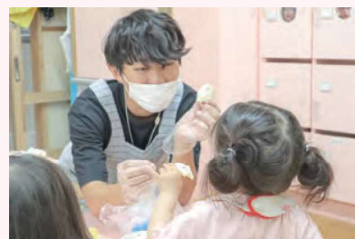
栄養バランスの整った給食は、 こども園の中で作られています。