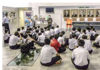
←課外授業で村の歴史を話す 案内ボランティア