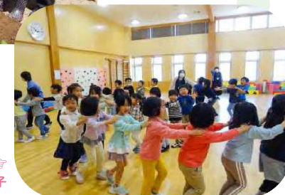
小学1年生とお里帰り交流 ☞ じゃんけん列車で遊んでいる様子