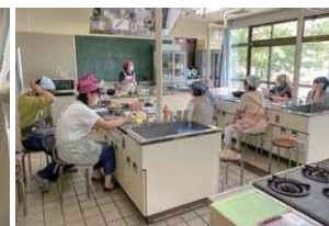
料理教室のようす