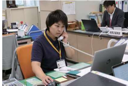
移住の電話相談受付