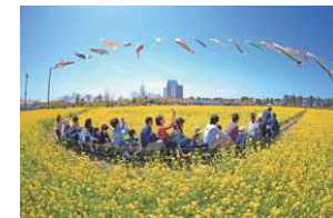
「村の一大イベント」 「桜と菜の花まつり」