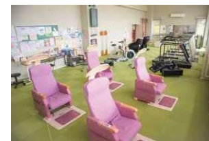
保健センター内 機能訓練室