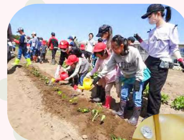
☞ 小学5年生とさつまいもの苗植え