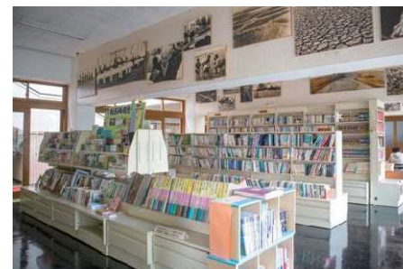
新刊から名著までそろっている図書室