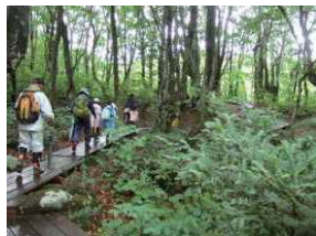
一國保事業健康ウォーキングのようす