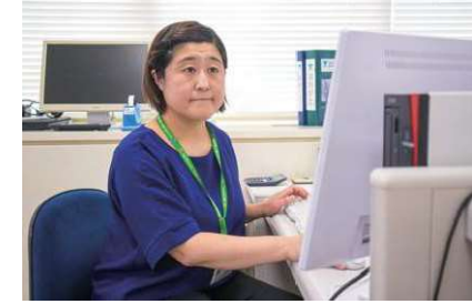
システムを用いた出納業務