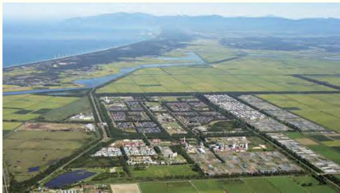
集落地 総合中心地

春には桜と菜の花、夏にはサルビアとひまわりが咲き誇り、秋には稲穂が黄金色に色づき、冬には雪に覆われた田んぼに白鳥が訪れる自然が美しい村です。また、村全域が「男鹿半島・大潟ジオパーク」に認定されています。