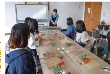
「スワックづくり教室」 →公民館講座