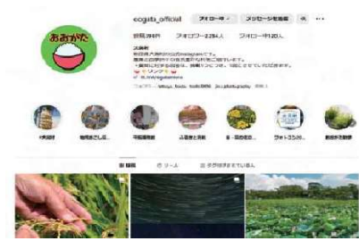
村のインスタグラム