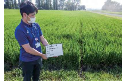
ほ場確認のようす