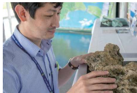
展示内容を考える職員