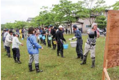
住民による防災訓練