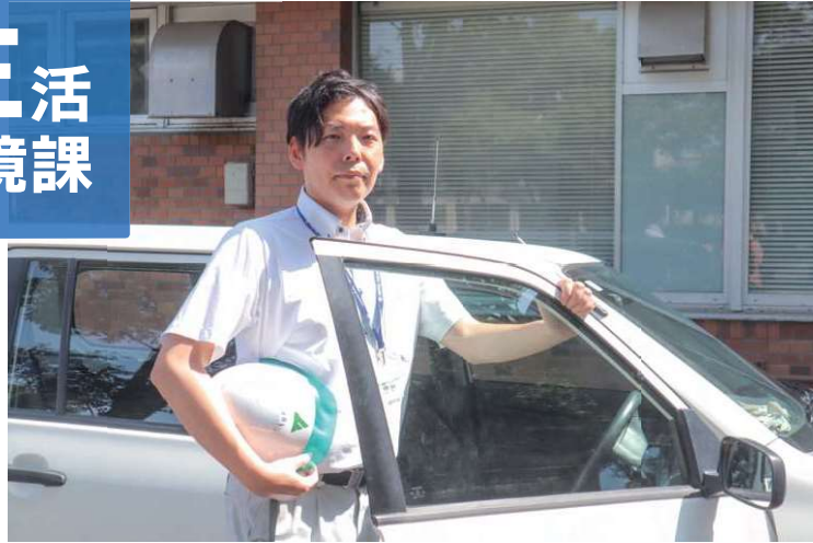
公用車で現場へ向かうようす