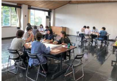
若手職員のグループ別研修