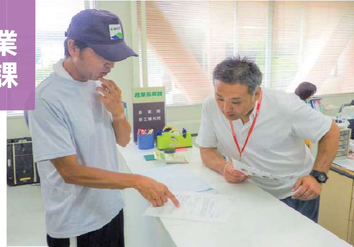
農業生産者への窓口対応