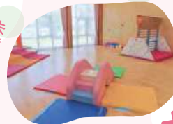
未 満 児 の 部 屋