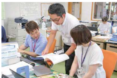
職員間で情報共有しながら業務を進めるようす